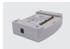
CARICABATTERIE DA TAVOLO DEL GRUPPO BATTERIE (OPZIONALE)