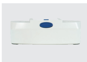
GRUPPO BATTERIE A 16 CELLE