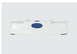
GRUPPO BATTERIE A 8 CELLE