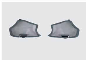
FILTRO ESTERNO PER GROSSO PARTICOLATO