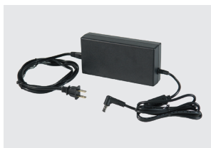
ALIMENTATORE CA (TUTTI I CAVI INCLUSI)