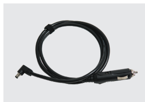
CAVO DI ALIMENTAZIONE CC