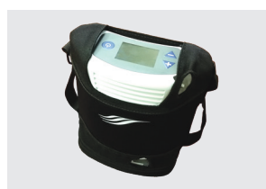
BORSA PER IL TRASPORTO